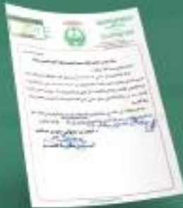
خطاب موافقة على إقامة الدورة