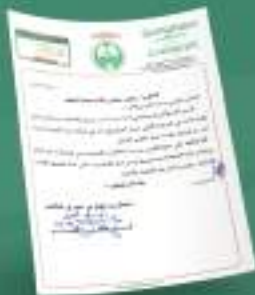
خطاب شكر ومباركة